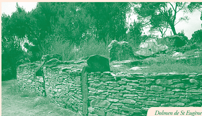
Dolmen de St Eugène

Nord, suivre le mur de pierres verticales ⑤, (capitelle) bordant un vaste enclos (tapis de cistes). À l'Est, beau point de vue sur le village, le Crapam, l'Alaric. Descendre vers Pech Majou Nord (petite capitelle restaurée avec une porte au Nord). Arriver à une grande capitelle carrée ⑥ (voûte avec dôme, ouvertures ébrasées au Nord et à l'Est), par un escalier de 12 marches. Sur les côtés, a été construit un mur incliné, dont les pierres se chevauchent en forme d'écailles. Emprunter le « Carretal » ⑦ (chemin de charrette) vers l'Ouest (belle allée rectiligne de 100 m, bordée de murettes bien restaurées). Tourner à droite, longer le mur, panorama sur Figuières. Descendre vers Figuières, traverser un grand bois de pins vers la Métairie Neuve ⑧. Suivre le chemin de Fontanilles, descendre jusqu'au ruisseau que l'on franchit. Traverser un bois de magnifiques pins d'Alep, de genévriers cade ⑨, pour arriver à Rancoule (voir une capitelle carrée, dans une vigne, près d'un chemin encaissé). Suivre le chemin qui longe des vignes. Capitelle carrée massive à gauche. Arriver à « l'enclos » du Pont de Canet (mur de pierres verticales ou obliques). Capitelle carrée ⑩ appuyée au mur. Arriver à la Croix de St Pierre au-dessus du lac, et rejoindre le village.