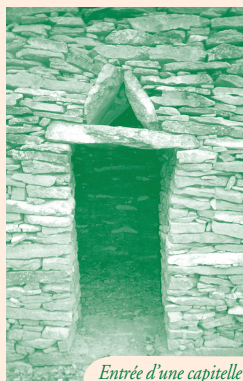
Entrée d'une capitelle

L'association « Patrimoine Lauranais » a créée et entretient le sentier de randonnée « les Capitelles ».